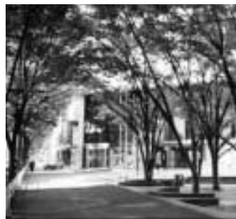
美しいまち並みを目指して

景観形成基準は、景観形成モデル地区内で美しいまち並みを創り出すことを目的に定めたもので、建物や建物を建てたり広告物を設置したりする場合に、意匠や色彩などについて定めたルールです。建築確認申請などを提出する日の三十日前までに、届け出が必要です。 対象区域は中央通り入り口から本町二丁目交差点(五差路)東側の天狗坂までの区間で国道50