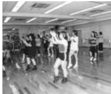
音楽に合わせて楽しく

水曜十回 1月9日～3月13日の木曜十回 1月10日～3月14日の金曜十回、 午後6時30分～8時 は午前10時30分～正午 対象 中学生以下を除く、各四十人(抽選) 参加費 各二千元 申し込み 12月18日 (必着) までに往復八ガキで