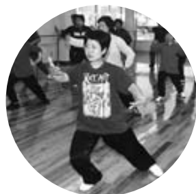
ゆっくり深呼吸しながら

曜十回、午後6時30分～8時 対象 中学生以下を除く、三十人(抽選) 参加費 二千元 申し込み 12月22日 (必着) までに往復八ガキで