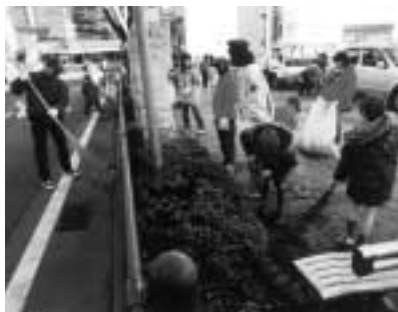
みんなで清掃しきれいな街に

クリーン前橋運動推進協議会とすばらしい前橋 市民活動協議会では、今年もJR前橋駅前通りを中心に、清掃奉仕活動を行います。軍手とゴミ袋は主