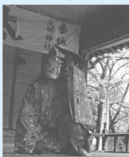
古式豊かな舞を奉納

たが、近年では五月三日に奉納「春になると山から神が下りてきて田の神になり、豊作を祈願した」ことが始まりといわれています。