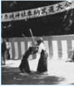
日ごろの成果を發揮