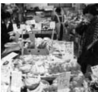
期間中にはプレゼントも

前橋周辺商店街連絡協議会で、十二月十四日 まで、歳末同組合事務局 260 6547へ。