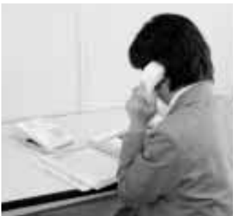
自分だけで悩まないで

日時 11月24日～2月7日の水曜三回、午後7時～9時 会場 前橋合同庁舎(上細井町) 対象 高校生以上、先着三十人 申し込み 12月15日(金)までに前橋土木事務所☎234-4228へ