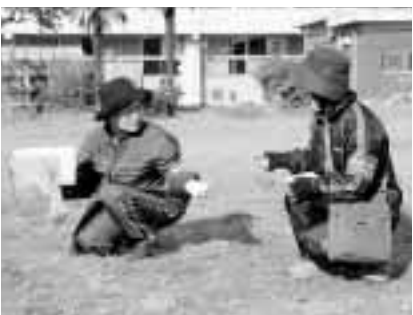
目印に必ず腕章をしています

日時=12月17日(日)午前10時～午後3時 会場=昭和の森(仮称。勢多郡富士見村) 対象=どなたでも用意する物=作業ができる服、草刈り機(持っている人)、水・弁当、雨具 申し込み=当日会場へ直接 ○…問い合わせは昭和の森(仮称)整備実行委員会準備会☎255-3450へ。