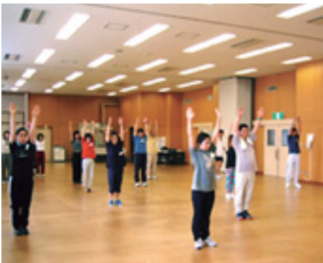
できることから始めよう

ヘルスアップ・トライ運動教室、運動を習慣化してみませんか 日時 5月12日(月)～8月5日(火)の13回、午前9時30分～11時30分 会場 前橋保健センター 対象 初めて参加する運動制限のない64歳以下の人、先着30人 費用 1,020円