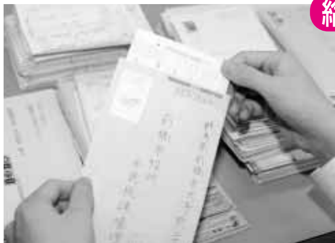
郵送などで期日までに提出を

前橋税務署と税理士会前橋支部で、所得税・贈与税・個人事業者の消費税について申告の相談を行います。期間中は二月十八日・二十五日の日曜も窓口を開設。平日に都合が付かない人は、ぜひ、ご利用