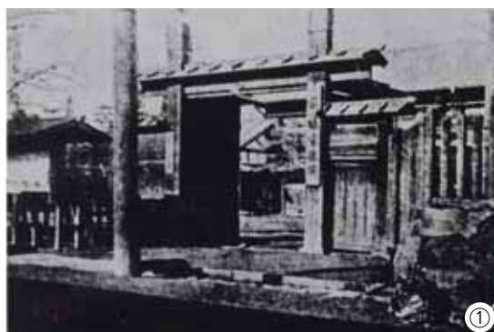
① 明治時代の市役所です。市制施行当初は旧町役場を使用していました。② にぎわう街の光景。現在の住吉町二丁目あたりに芝居小屋がありました。製糸工場に働く人の憩いの場です。

江戸時代末から製糸業が盛んな前橋でしたが、明治時代に入り我が国初の機械製糸工場が設立され発展を遂げます。県令（現在の知事）・楫取素彦や初代市長となった下村善太郎らの尽力で県庁が誘致され、明治25年に前橋市が誕生。電灯や電話、鉄道などの整備が進み市の経済力が進展するにつれ、街がにぎわっていきました。