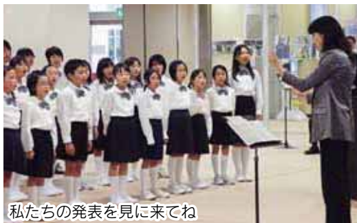
私たちの発表を見に来てね

市制施行120周年記念事業・まえばし学校フェスタ2012を開催。市内の小中特別支援学校と市立前橋高の児童生徒が、日頃学校で行っている文化活動の発表や展示などを行います。