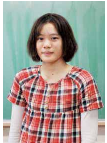
水泳ジュニアオリ ピックで全国2位