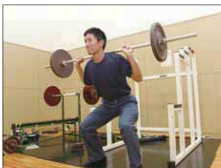
すぐに出動できるよ 重いバーベルを楽々持ち上げます