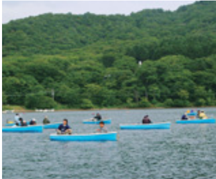
秋のさわやかな風の中で

赤城山大沼のワカサギ釣りが9月1日(月)から解禁となります。静寂に包まれた大沼湖上でワカサギ