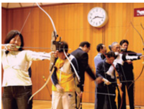
丁寧に教えますので気軽に参加を

日時 9月17日(水)～10月1日(水)の水曜5回、午後7時～8時30分 対象 小4以上、先着15人 費用 一般2,000円、中学生以下500円 申し込み 8月15日(金)から同館 ☎265-0900へ □ストレッチ軽スポーツ 日時 ①9月17日～11月5日の水曜8回 ②9月19日～11月14日の金曜8回、午前10時～11時30分 対象 中学生以下を除く、各40人(抽選) 費用 各2,000円と施設使用料