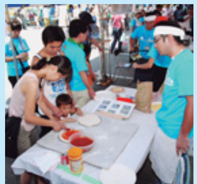
親子でピザ作り (昨年)