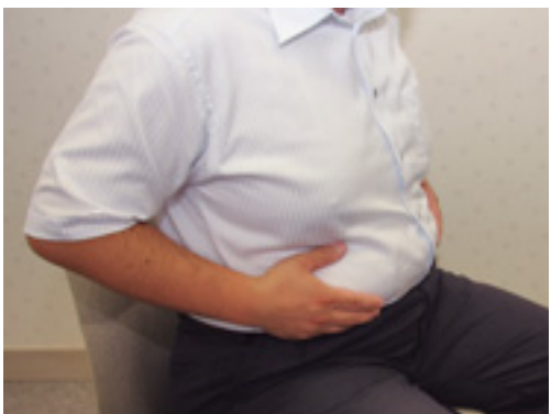
気になるおなかをすつきりさせよう