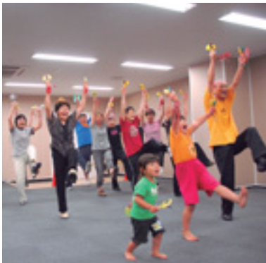
楽しく踊りませんか

前橋まつりに向けて「こんばんはだんべえ踊り教室」を開催します。 日時 9月8日～10月6日の月曜、午後7時30分～9時 会場 前橋プラザ元気21・1階にぎ