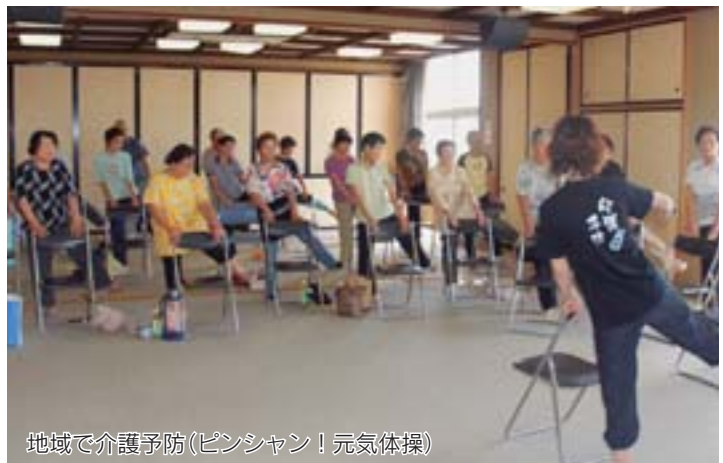
地域で介護予防(ピンシャン！元気体操)

し、市民の皆さんと一緒に健康運動を展開していくために「元気ひろげたいそう」や「ピンシャン！元気体操」を発足。公民館や老人福祉センターなど市内各所で行っています。栄養については、3月に市民のための食育推進計画である「元気まえばし食育プラン」を策定。規則正しいバランスのとれた食生活は健康の