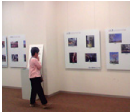
前橋の美しい風景を展示

前橋の美しい風景を将来にわたって守りはぐくむことをテーマにまえばし景観展を開催。昨年度実施した、