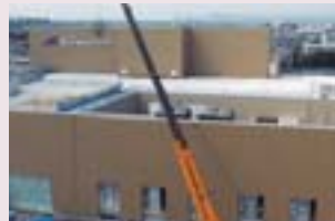
重粒子線治療施設

この治療は、平成15年に先進医療として認められましたが、あまり普及していないことから、一般の保険診療として認められていません。このため、現段階では、約300万円の治療費が想定され、高額であることから、できるだけ早く保険適用となることが望まれます。