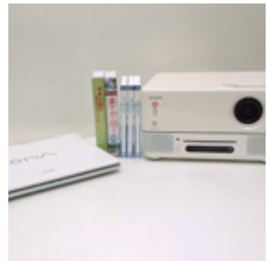
災害に強いまちづくりに