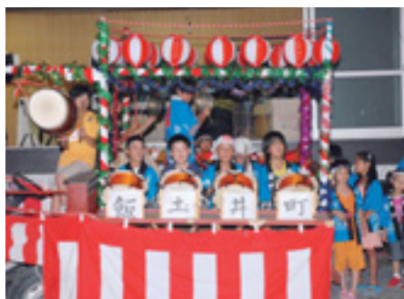
納涼祭で楽しく にぎやかに踊る