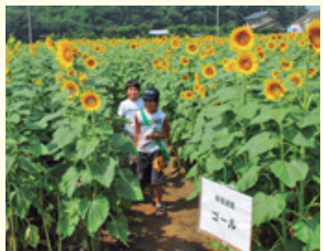
タイムトライアル（昨年）

西大室町のヒマワリ田は5・4畝。一面にヒマワリの花が咲き乱れます。迷路のタイムトライアルやかき氷、ポップコーンの無料配布など、楽しいイベントを開催。ぜひ、ご家族でお出掛けください。 日時 8月23日(土)午前9時～11時30分