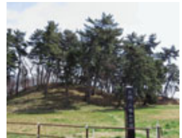
静かにたたずむ八幡山古墳

0歳ほど進むと突き当たりに小高い丘が見えてきます。これは4世紀後半に造られたといわれる国指定史跡・八幡山古墳です。全長は130歳。本県で最も古い大型古墳の一つで、四角と四角の組み合わせからなる前方後方墳としては、東日本一の規模を誇ります。