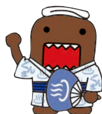
ほかほかどーもくん

4月2日(月)から、NHK総合テレビで「ほっとぐんま640」を放送します。県内のニュースや生活情報、気象情報などをお届けします。放送日時＝月曜～金曜、午後6時40分～59分