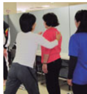
背筋をまっすぐに

市民協働事業「高齢者のためのアンチエイジング教室」に参加しませんか。ストレッチやウォーキング、専門家の講話などを通して、楽しく続けられる運動方法を学びます。 日時 4月24日～来年3月26日の第2・4火曜20回、午前9時30分～11時30分 会場 前橋プラザ元気21 対象 運動制限のない65歳以上の、10人(抽選) 費用 6,000円 ☎4月13日(金)までに住所・氏名・年齢・電話番号を記入し、前橋ランナーズにファクス(252-8734)で ☎介護高齢課 ☎898-6133へ