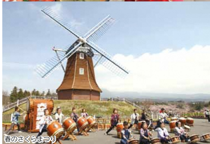
春のさくらまつり

国道353号沿いのオランダ型風車が目印の道の駅ぐりんふらわー牧場・大胡では、小動物コーナーやバンガロー、バーベキューガーデンなどが大人気。風車のもとで、春はさくらまつり、秋にはウィンドミルフェスティバルを開催します。隣接する花木農産物直売所さんぼ道の牧場ソフトクリームは濃厚でボリュームたっぷり。ドライブの途中で立ち寄り、家族でのんびりするにはちょうど良い道の駅。お勧めです。