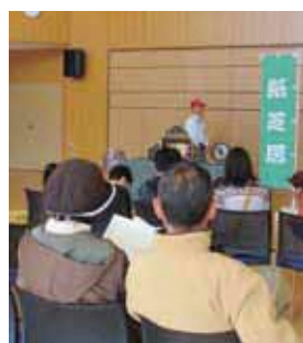
ワクワクする時間で