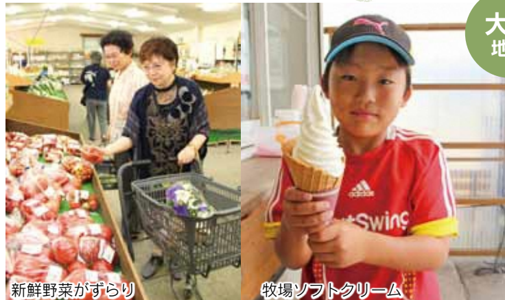
新鮮野菜がずらり