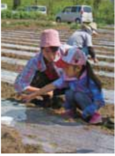
家族で種をまこう

大根と宮内菜を作ってみませんか。収穫後、大根は干してたくあん漬けに仕上げます。日時 9月9日(日)午前9時30分(たくあん漬け)12月上旬