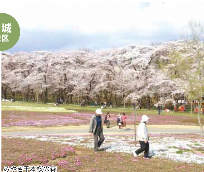
みやぎ千本桜の森

新築した宮城支所は、人や環境に優しい施設。支所内の市立図書館宮城分館は、毎日多くの市民が訪れます。冷暖房の完備された宮城幼稚園は、太陽エネルギーを使ったエコな園舎や芝生の園庭など設備が充実。園児の笑顔があふれています。