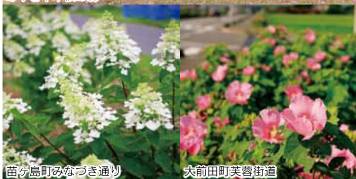
苗ヶ島町みなづき通り