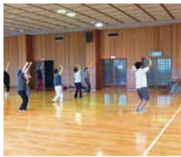
ゆったり踊って筋力アップ

前橋市民サックスデーを開催します。試合の対戦相手は石川ミリオンスターズ。市内在住の小中学生や65歳以上、福祉施設入所者は入場料無料で、本市民は半額となります。 日時 = 8月19日(日)午後6時試合開始 会場 = 前橋市民球場 □小中学生対象イベント 内容 = 選手とのふれあいキャッチボール ①当日午後5時までに会場へ直接 ②同球団事務所 ☎289-3033 へ