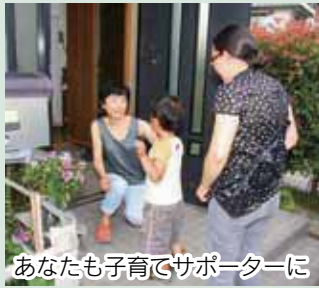
あなたも子育てサポーターに

ファミリー・サポート・センターでは、自宅での子どもの預かりなど、子育ての手伝いをする「まかせて・どっちも会員」を募集。その説明会と講習会を開催します。事前申し込みで先着5人まで未就学児の託児ができます。 日時=9月4日(火)~7日(金)の4回、午前9時~午後4時(7日は午後4時30分まで) 会場=勤労女性センター(総合教育プラザ内) 対象=一般、先着30人 ☑8月24日(金)までにファミリー・サポート・センター☎230-9007へ