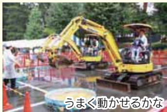
うまく動かせるかな

道路について楽しみながら学べるイベントを同時開催。重機乗車体験やお楽しみコーナーなどを行います。