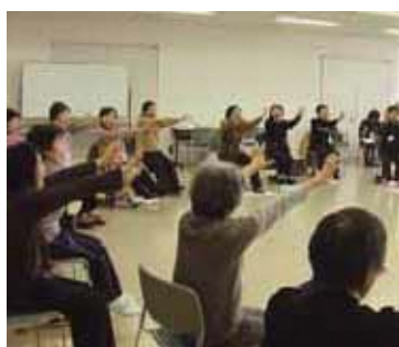
声を出して元氣よく