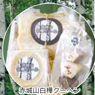
赤城山白樺クーヘン

いい・しらかわ児童クラブが石井小内に完成し、現在38人の児童が学年を超えてみんなで一緒に過ごしています。富士見中のプールを新築し、充実した教育環境となりました。赤城少年自然の家と青木旅館本館の間に位置するミズナラ原生林には、ミズナラを身近に感じて歩ける787mの遊歩道が完成。赤城山の新しい観光スポットになっています。