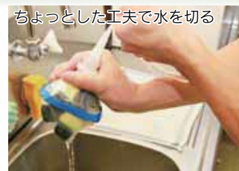
ちょっとした工夫で水を切る

A 臭いの原因は水分です。水分が多いと腐敗が進みやすいため、しっかりと水を切ってください。ペットボトルを再利用して、簡単にしぼり器を作ることができます(右上写真)。また、本市では生ごみ処理容器や電動生ごみ処理機の購入助成を行って