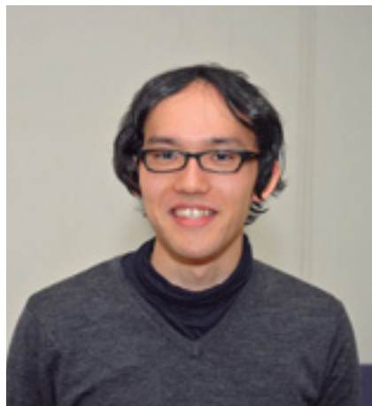
設計コンペティションで最優秀賞