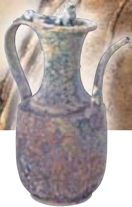
和田山天神前遺跡出土の水瓶