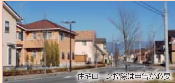
住宅ローン控除は申告が必要

住民税からの住宅ローン控除の適用を受けるためには、毎年住宅ローン控除の申告が必要です。確定申告をする人は、その際に住宅ローン控除申告書を提出してください。なお、年末調整のみの方は控除申告書に必要事項を記入し、市役所市民税課へ郵送での提出もできます。