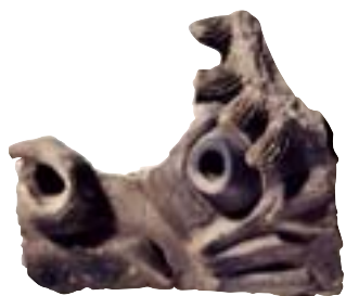
前橋城遺跡出土のしゃちほこ