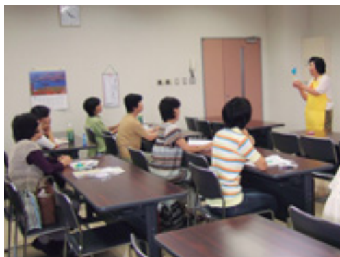
保育の基本を学ぶ講習会

対象 一般、先着30人 内容 制度の概要、保育の基本など 申し込み 1月23日(金)までに同センター ☎230-9007へ