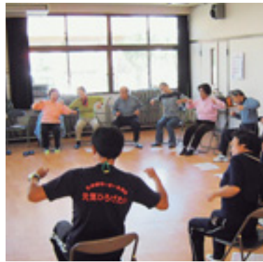
心身ともに健康に

日時 1月23日(金)午後7時～8時30分 会場 前橋プラザ元氣21 対象 市内在住・在勤の人、先着10人