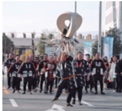
新年を飾る伝統行事

消防隊員の団結と士気の高揚を図る新年恒例の消防隊出初め式を開催。式典に伴い県庁前通りは正午から午後3時まで通行止めとなります。 日時 1月11日(日)午後1時～2時30分