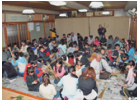
伝統行事を通じ 触れ合い深める