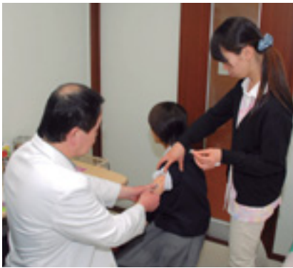
早めに2度目の接種を

麻しん(はしか)は1度予防接種を受けた人でも、免疫が低下するとかかることがあります。このため本