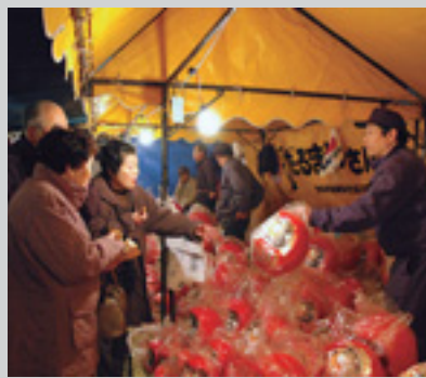
だるまを求めて行列が

一年の福を呼び込む 縁起だるまがずらり 毎年恒例、新春の風物詩「少林山七草大祭だるま市」を開催します。会場となる少林山達磨寺は、だるまを売る露店が多く並ぶほか、無