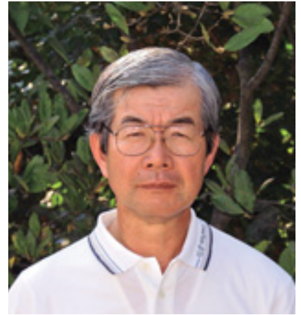
第2回県農業賞を受賞