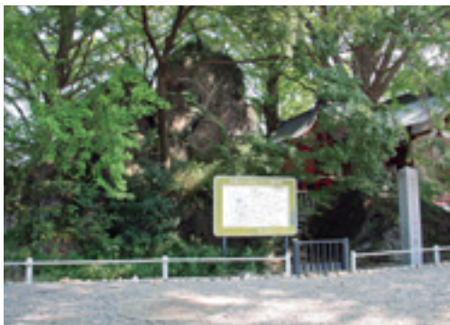
太古の記憶が刻まれた石

この巨石は、3つの石が集まっているように見えますが、実は1つの大きな石の塊です。高さは約10メートル、周囲は約70メートル。これまでは赤城山の噴火によってできた石、いわゆる「流れ山」が利根川によって浸食されたといわれてきましたが、近年になって、2万4,000年前の浅間山の崩壊に由来する石が、同じく利根川によって浸食されたという説も出てきています。この2つの説には、どちらも赤城山、浅間山という巨大火山と利根川が関わっており、人知の及ばぬ自然の力の雄大さやすさまじさを想像することができます。