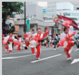
激しいダンスで観客を魅了

「轟くこと雷鳴の如く激しきこと稲妻の如し」とうたわれる、たかさき雷舞フェスティバルを開催。県内外から集まった32チームが、各会場