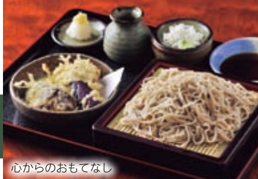
心からのおもてなし