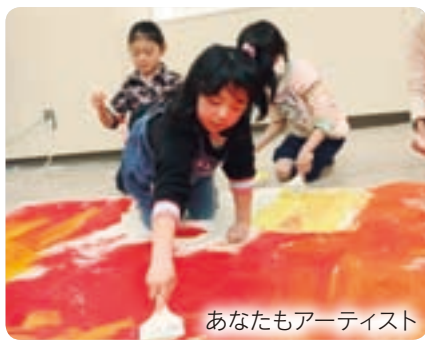
あなたもアーティスト

来年度中に前橋プラザ元氣21別館(旧ウオーク館)に開館を予定している前橋市美術館(仮称)。美術館開館の準備期間中も多くの人が活動に参加できるプレイベントなどを開催します。詳しくは本市の美術館構想公式ホームページ( http://www.artsmaebashi.jp/ )をご覧ください。