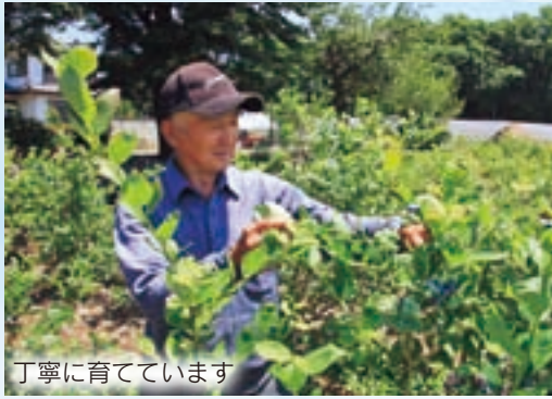
丁寧に育てています

ベリーファームでは特別サービスを実施。ことしの夏は、楽しくおいしいブルーベリー狩りを家族で体験しよう。 サービス①入園料50円引き (7月〜8月中旬) ②ジェラート・ソフトクリーム30円引き 問い合わせ①ベリーファーム(富士見町赤城山) ☎288-2158へ