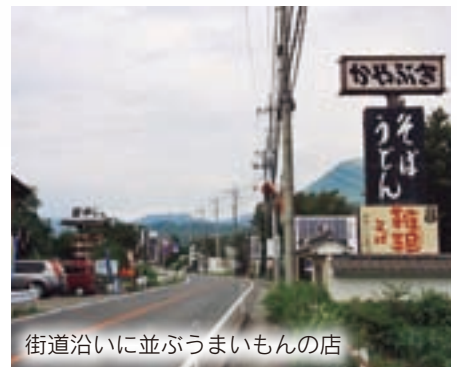
街道沿いに並ぶうまいもの店

DC期間中は、各店がオリジナルのサービスを用意します。さわやかな風吹く赤城南ろくグルメ街道へ、おいしい料理を探しに出掛けませんか。会場①富士見町赤城山県道前橋・赤城線沿いほか 問い合わせ②富士見町商工会 ☎288-2593