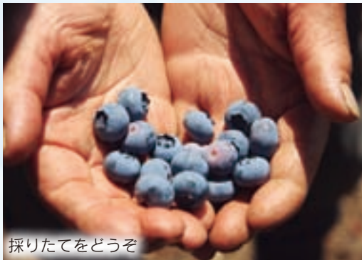
採りたてをどうぞ