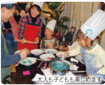
大人も子どもも楽しめます