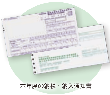
本年度の納税・納入通知書

また、後期高齢者医療保険料の納付を特別徴収から口座振替に変更する場合は、金融機関での申し込みのほかに、市役所へ「納付方法変更届」の提出が必要で