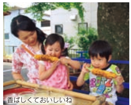
香ばしくておいしいね