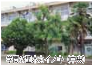
学問の聖木カインノキ (中央)

岩神地区。梅雨の晴れ間に歩いてみませんか。学問が息づく敷島・岩神地区。梅雨の晴れ間に歩いてみませんか。