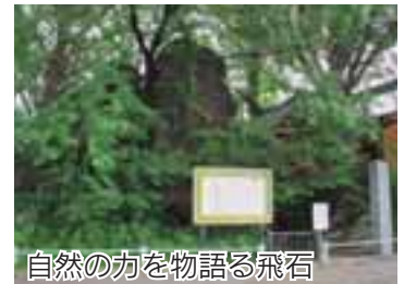
自然の力を語る飛石