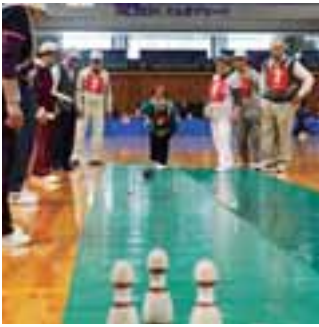
高得点を目指して