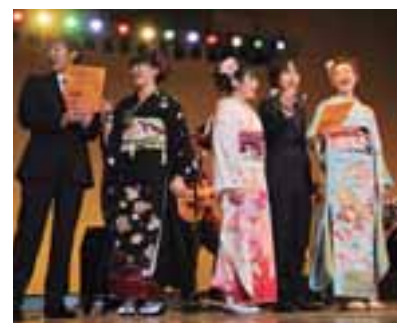
思い出に残る式典に

来年1月8日(日)に開催する成人祝式典の企画運営を行う委員を募集します。 対象 市内在住で次のすべてを満たす人、3人(選考) ①