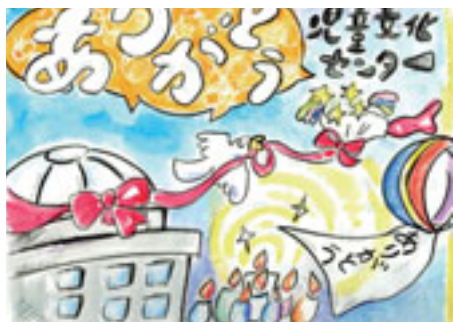
新旧センターがバトンタッチ