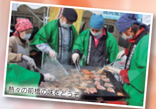
熱々の前橋の味をどうぞ