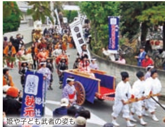
姫や子ども武者の姿も