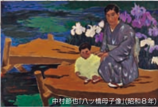
中村節也「八ッ橋母子像」(昭和8年)