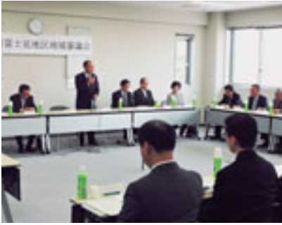
地域の発展のために