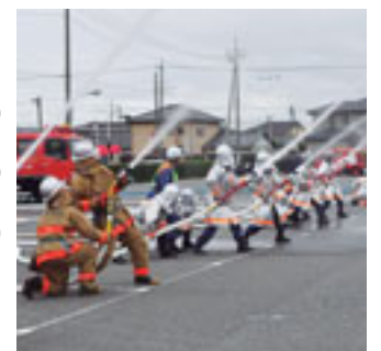
頼もしい隊員たち