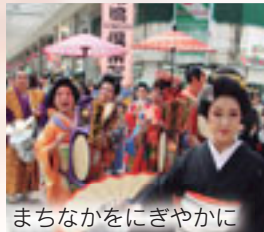
まちなかをにぎやかに