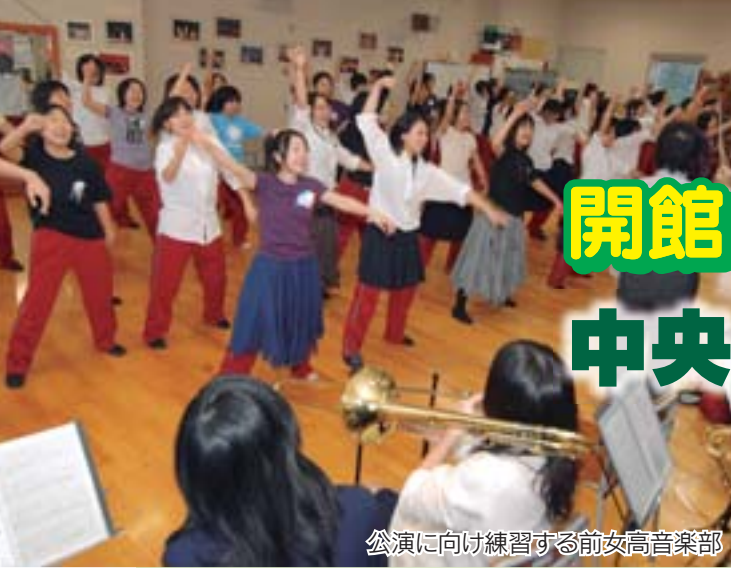
公演に向け練習する前女高音楽部