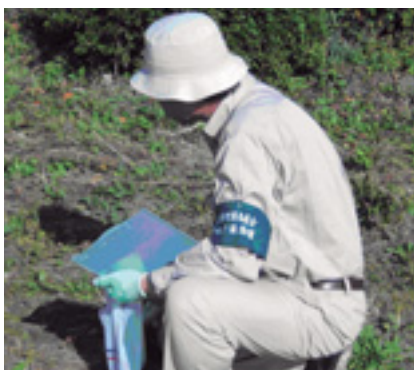
腕章をつけて調査を行います

遺跡地図の作成に向けた遺跡分布調査を来月から行います。緑色の腕章を付けた職員や作業員が、田畑や空き地に入り、落ちていた土器片や石器などを採集。ご協力をお願いします。