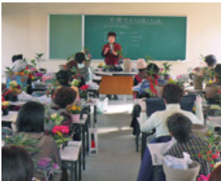
昨年度の寄せ植え教室の様子

申し込み 12月1日(月)(必着)までに往復ハガキで。住所・氏名・電話番号・教室名を明記し、市役所公園緑地課内「まちを緑にする会事務局」(☎898-6842)へ