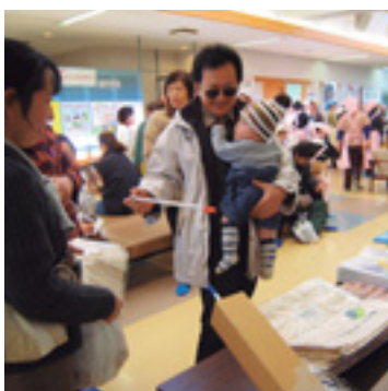
エコバッグの抽選会も

「あなたが主役の健康づくり」をテーマに健康まつりを開催します。血管年齢測定や骨密度測定な