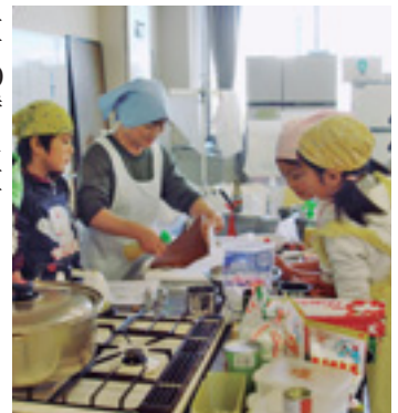
みんなで作るから楽しい