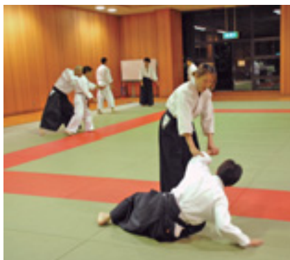
初歩から丁寧に指導します

日時 11月29日～12月27日の土日曜 9回、午後3時～5時（日曜は午前 9時～11時）