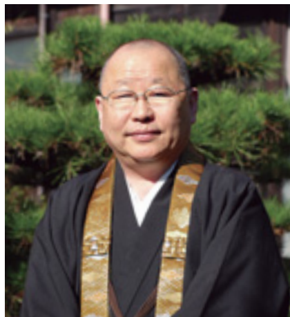
行政相談委員で総務大臣賞を受賞