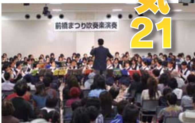
大盛況だった吹奏楽演奏(にぎわいホール)