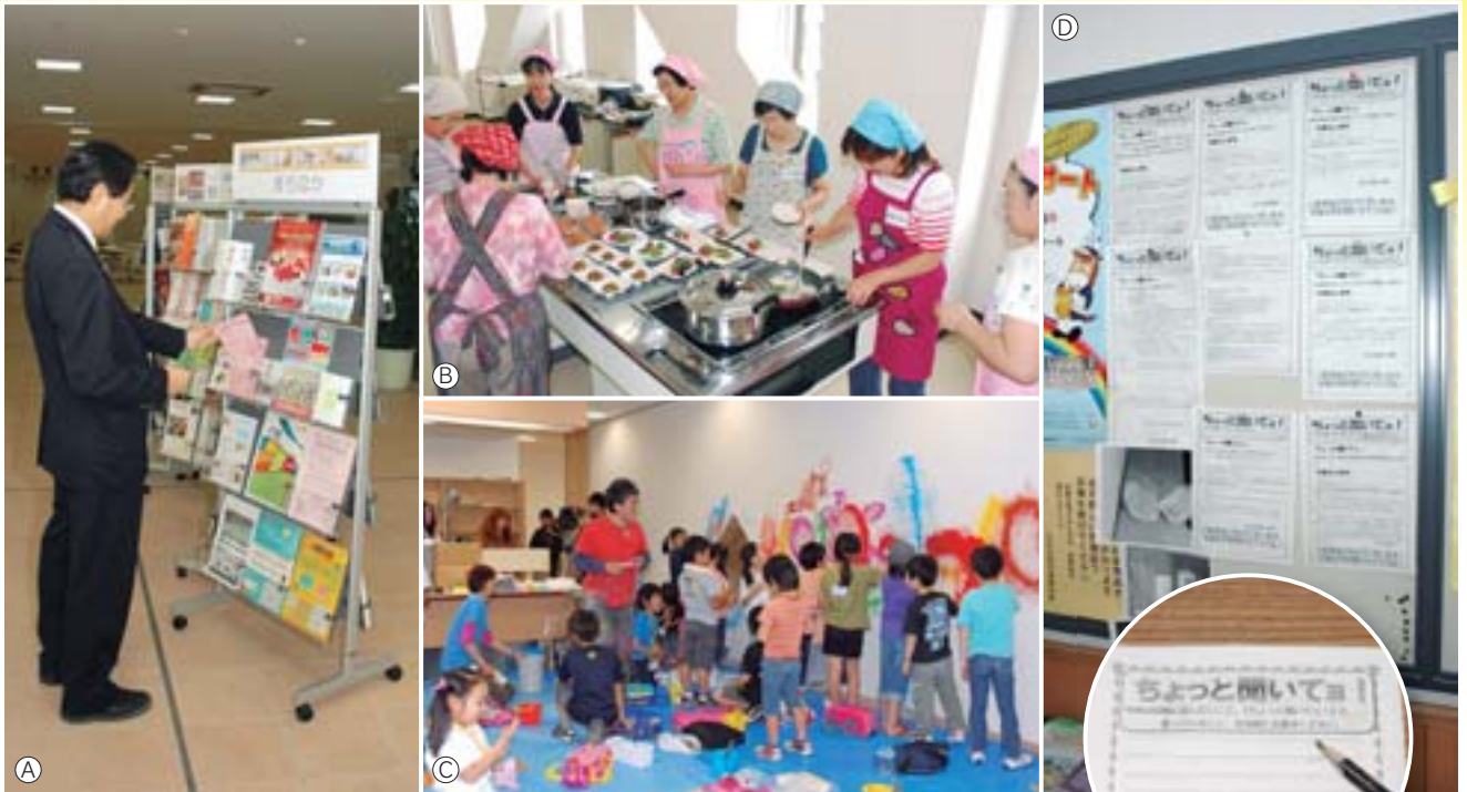
①商店街関係のチラシやパンフレットが置かれている（1階）②IHクッキングヒーターで、安全に楽しく（5階料理実習室）③子どもたちが壁画を描く（こども図書館）④来館者が気持ちよく利用できるよう要望や意見を掲示（3階）