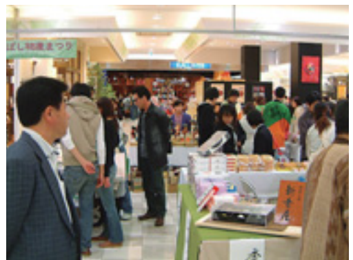
本市の名産品が並びます

日時 11月28日(金)〜30日(日)、午前10時〜午後7時（30日は午後4時まで）