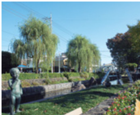
お気に入りの場所を作品に

(日)、午前9時30分~午後5時②12月13日(土)~21日(日)、午前9時~午後5時(21日は午後3時まで) 会場〓①は前橋文学館②は市民文化会館 内容〓萩原朔太郎の詩集「氷島」の題名から子どもたちがイメージした絵の作品展 □「お気に入りの場所展」さまざまな表情をもつ風景たち」作品募集 募集内容〓気に入っている場所や思い出の場所を写真・絵・詩・短歌・俳句などの表現方法で作品にしたものとそれらにまつわる50字以内の簡単な言葉 規格〓〈写真・絵〉四つ切り(254ミ×305ミ)、六つ切り(203ミ×254ミ)、ハガキのいずれかのサイズ。絵は紙に描いたもので、画材は自由(詩・短歌・俳句など) A3以下のサイズの紙に書いたもの。紙の種類・筆記具は自由