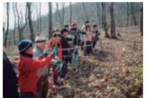
自然体験で冬を楽しもう