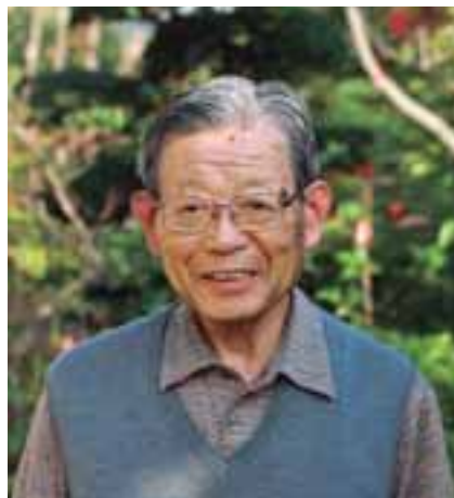
県内で唯一の社会貢献者表彰