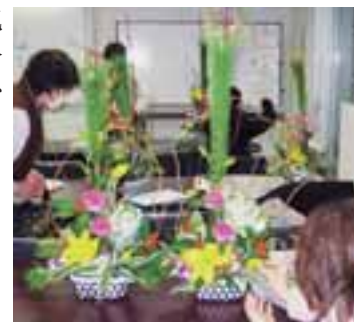
華やかにアレンジ

☎ 11月25日(木)(必着)までに往 復ハガキで。講座名・住所・氏 名・職業・電話番号・託児希望 の場合は子どもの人数と年齢を