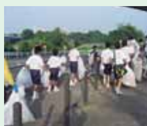
みんなでごみ拾い

事は、イベントの手伝いをする事です。幼児や小学生に喜んでもらえるよう、みんなで一生懸命がんばっています。