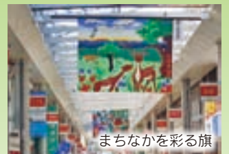
まちなかを彩る旗