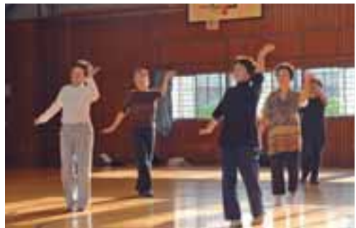
リズムに合わせて体操しよう

12月12日(日) 午前10時～10時45分 午前10時45分～11時30分 午前11時30分～午後0時15分 午後0時15分～午後1時15分 午後1時15分～午後2時45分 午後2時45分～午後3時30分 会場 前橋プラザ元氣21 対象 一般、先着各20人 12月10日(金)までに市民体育館 265-0900へ