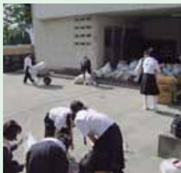
たくさんの有価物が集まる

2つ目は、のびゆくこどものためのボランティアです。毎年、担当するボランティア委員だけでなく、たくさん生徒が自主的に参加しています。ここでの主な仕