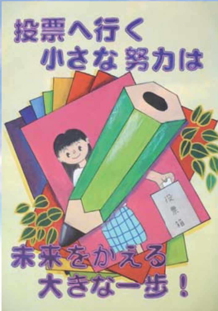
全国明るい選挙啓発ポスターコンクール 「明るい選挙推進協会会長・都道府県選挙管理委員会連合会会長賞」作品

問い合わせは 選挙管理委員会事務局 入場券については 市民課 ☎898-6742 ☎898-6102