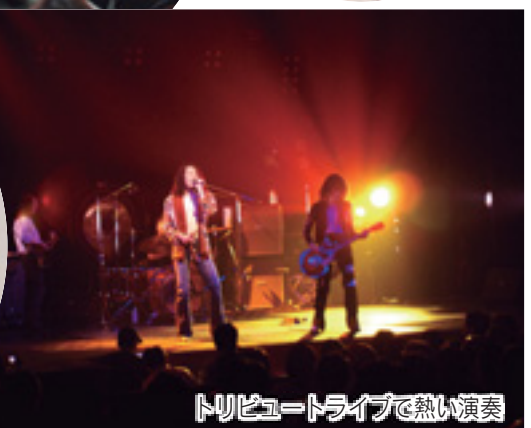
トリビュートライブで熱い演奏