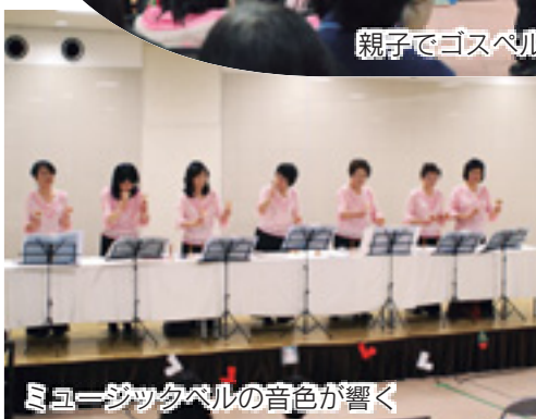
ミュージックベルの音色が響く