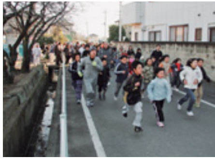
朝日を浴び力走 親ぼく深める