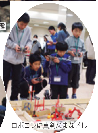
ロボコンに真剣なまなざし