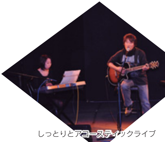
しっとりとしたアコースティックライブ