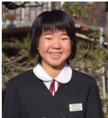
交通安全コンクールで最優秀賞