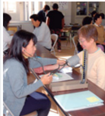
健康な毎日を過ごすために