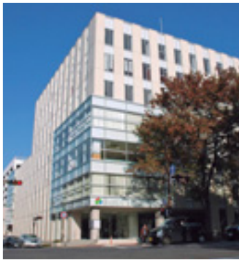
会場の前橋プラザ元氣21

2月5日(木)から3月16日(月)まで、前橋プラザ元氣21で所得税・贈与税・個人事業者の消費税についての申告相談を行います。土日曜・祝日は休みですが、2月22日(日)と3月1日(日)には窓口を開設。平日来場でき