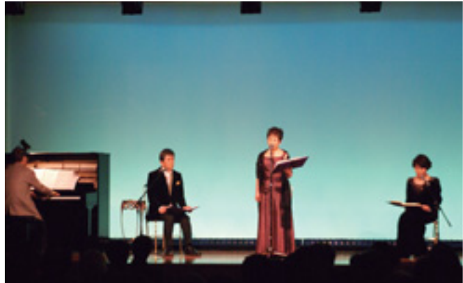
ピアノに合わせて源氏物語を朗読

前橋プラザ元気21が、昨年12月にオープン1周年を迎えました。これを記念し、同館を中心にさまざまなイベントを開催。源氏物語の朗読や個性あふれるライブステージ、日ごろの生涯学習活動の発表などが行われ、にぎやかに1周年を祝いました。