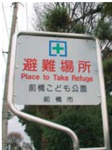
この標識が目印です

避難場所を確認し、家族との集合場所を確認しておきましょう。避難訓練などにも参加しましょう。