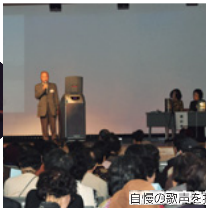
自慢の歌声を披露