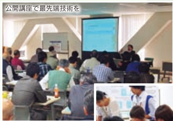
公開講座で最先端技術を

これらの講座を受けた人からは、「分かりやすく話をしてもらって充実した時間を過ごせた。今後も続けてもらいたい」という声を多くいただいているそうです。