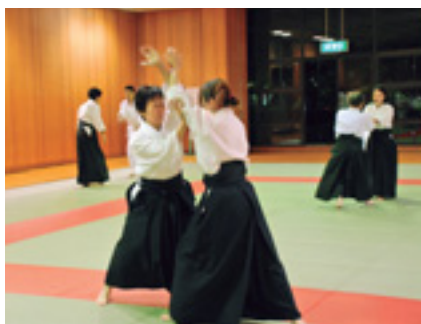
けいこを通じて丈夫な体に