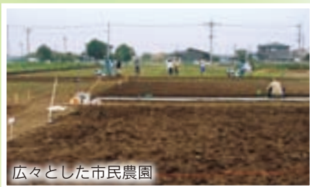
広々とした市民農園

同大では、地域コミュニティの再生を進めるための研究も行っています。最近では、六供・松並木地区におけるグリーンプロジェクト事業を始めたそうです。この事業は、地区内の空き地をオープンガーデンとして、遊休農地を市民農園として市民に提供し活用しようとするもの。多くの人が世代を超え、気軽に触れ合える場として活用していきたいとのこと。