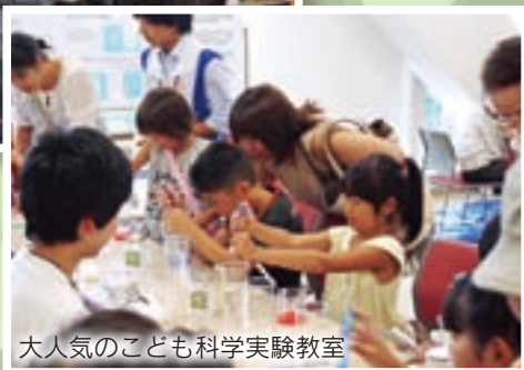
大人気のこども科学実験教室

大学は敷居が高く、遠い存在だと思ってしまうがちですが、実はとても身近なところなのです。大学側としても、さらに地域との連携を深め、より近い存在になれるよう、今後も積極的に活動していきたいと話していました。