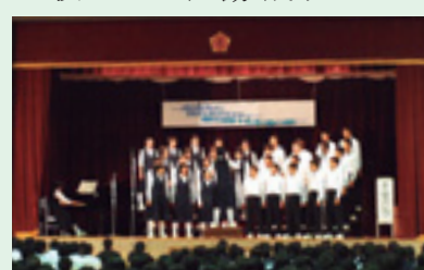
きれいな歌声を披露

また、秋には校内合唱コンクールが行われます。音楽の授業はもちろん、朝、昼、放課後と1日を通して練習。歌声と心を1つにして美しいハーモニーを作り出します。本番当日は各クラスの歌声が体育館中に響き渡り、コンクールの後は、クラスがより一層団結。3年で金賞を獲得したクラスは大胡地区の文化祭に代表として出場し、大胡中生の美しい歌声と団結力を披露します。 このほかにも、まだまだ本校の良い所はたくさんあります。これからも一人一人が成長し、より団結力を高め、良い所を伸ばしていきたいと思っています。