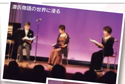
源氏物語の世界に浸る