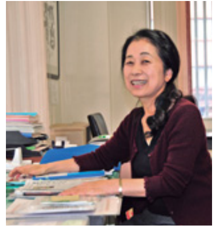
留学生や発展途上国の子どもを支援