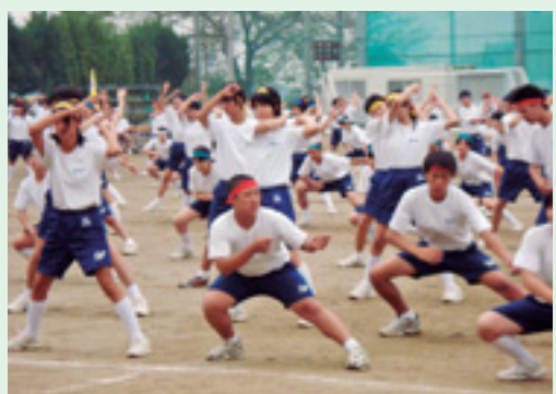
みんなで心を1つにして

本校の伝統的な行事の1つに、体育大会で踊るソーラン節があります。ソーラン節から始まる体育大会の練習。最後の練習の日まで一生懸命頑張ります。本番ではさまざま競技で個人・クラスが競い合いますが、フィナーレのソーラン節では、全校生徒の総勢540人が心を1つにして踊ります。