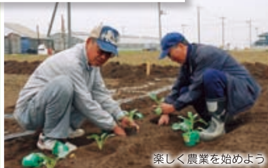
楽しく農業を始めよう

とでした。現在は試験的な取り組みの段階ですが、年明けから本格的に始動する予定だそうです。詳しくは問い合わせを。この事業に、より多くの人たちが参加することで、新たな地域コミュニティを生み出す力になるのかもしれない。今後注目していきたいでしょう。