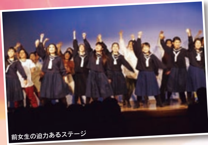
前女生の迫力あるステージ