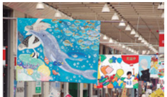
カラフルな旗が街を彩ります

中央通りアーケードで、旗を素材にしたアート作品の展覧会を開催します。市内の中学生が共同で、幅105cm、長さ180cmの旗生地をキャンバスに描いた作品。自由に柔軟な発想と感性が、大きな旗いっぱい描かれています。 期間 11月26日(木)〜来年1月26日(火) 会場 中央通りアーケード ☎文化国際課 ☎898-652