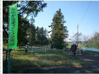
前橋東部建設業協議会さんと共同作業風景

10月29日(土)に、今年2回目の荒砥川美化活動を行いました。今回は前橋東部建設業協議会の皆さんと協力して広い範囲で除草作業を行いました。また木製ベンチ・テーブル周辺の清掃作業も行いました。