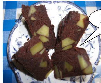
大人気!! いいもんケーキ

たくさんのご来場ありがとうございました。 係の皆さん、事前の準備から片付けまで大変お疲れ様でした。 また、今年も宮城中生徒70名がボランティアとして協力してくださいました。 大変お疲れ様でした。