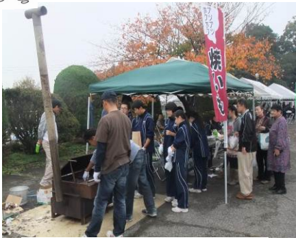
大人気!! 焼きも屋さん

毎年恒例となりました 第4回目のみやぎいいもん祭 りを11月6日(日)に開催しま した。 今年も『芋』をテーマにした いいもん汁、いいもんケーキ、 大学イモ、焼きも、など数々の 模擬店が立ち並び、また中学 生による輪投げコーナーや新 企画の太鼓セッションなど楽 しい催しも行われ、あいにく の天気でしたが、たくさんの方 の来場者でにぎわいました