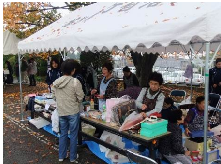
掘り出しものはあるかな?

チャリティーバザーに ご協力頂きありがとうございました。 売上げは宮城地区 社会福祉協議会への寄付金と 東日本大震災義援金にさせて いただきました。