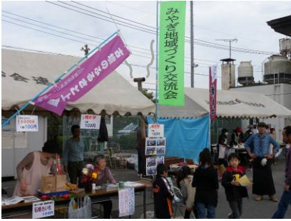
上川淵地区で宮城の“のろし”が上がりました

当日はいいもん祭りで行った、焼き芋機を使用した石焼き芋を行い、地区の皆さんに味わってもらいました。なかには焼き芋機が珍しいといういろいろ尋ねてくる人や、寸法を測る人などいました。