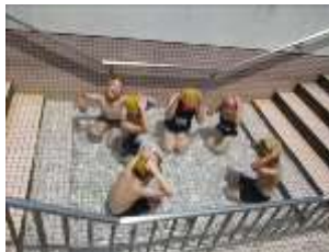
腰洗い槽に入る4年生