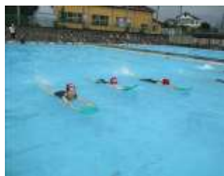
中プールで泳ぐ6年生