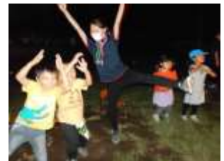
楽しかったキャンプファイヤー