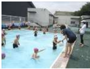
ブロック拾う2年生

待ちに待った、水泳の学習が始まりました。7月5日に警戒度が「2」に引き下げられたことにより、ようやくプールに入ることができました。何と云っても、2年ぶりの水泳学習です。1年生にとって、小学校生活で初めてのプール体験であることはもちろんですが、昨年度一度も水泳学習ができなかった2年生にとっても、初めてのプール体験です。また、3年生・4年生共に初めての「中プール」での水泳学習。さらに、5・6年生にとっても初めての「大プール」での水泳学習となりました。月日の経過を改めて実感しました。 7月12日(月)から、各学年が水泳学習を開始しました。全ての学年の児童にとって、初めての体験となる水泳学習です。体に水をかけてから、十分安全に気を付けながらゆっくりと水の中に入りました。皆で同じ方向へ歩いて大きな渦を作ったり、水中に潜ってゴム製のブロックを拾ったりしながら、少しずつ水に慣れるようにしていきました。水に慣れてくると、高学年は泳ぎの練習も始めました。 どの学年の児童も、「プールのきまり」を守り、安全に楽しく水泳の学習を行うことができました。梅雨空の合間を縫いながら、全ての学年の児童がプールに入れたことを大変嬉しく思います。今年の水泳学習は終わりますが、来年の夏が待ち遠しいことと思います。