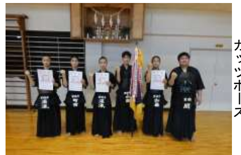
市優勝旗を手にして、ガッツポーズ

7月3日(土)ソフトテニス個人戦を皮切りに市内の各会場で前橋市中学校総合体育大会が開催され、各部活動とも3年生を中心に一生懸命取り組みました。残念ながら敗退してしまった部活動もありますが、3年生は、自分の力を出し切り、精一杯戦う姿を後輩たちに示してくれました。1・2年生はそんな先輩たちの姿を心に焼き付け、新しいチーム作りに生かしてくれることと期待しています。なお、以下の生徒が入賞・県大会への出場を果たしました。 保護者ならびに地域の皆様にはたくさんのお応援をいただき、心より感謝申し上げます。