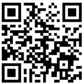
みやぎ地域づくり交流会 Facebookページ