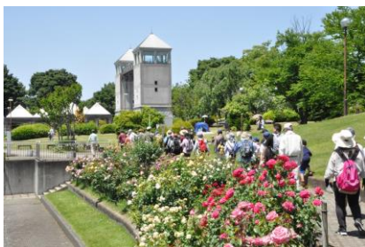
今年もフラワーパーク内を散策