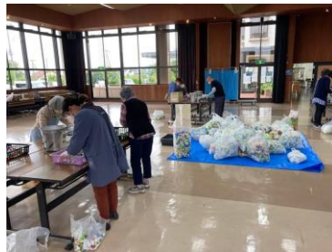
エコキャップの選別

令和4年6月15日(水) 福祉交流部会の皆さんを中 心に12名の方にご参加いた だき、エコキャップの選別を 行いました。 16袋174.0キロのキャッ プを発展途上国の医療支援 等に生かしていただきます。 次回は12月14日に実施予定 です。