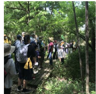
木漏れ日が気持ちよいどんぐりの森