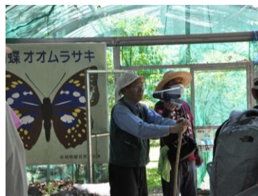
貴重なオオムラサキハウス見学