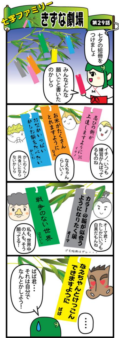
作：栗原治仁 画：榊澤ヤスヨキ ©みやぎ地域づくり交流会