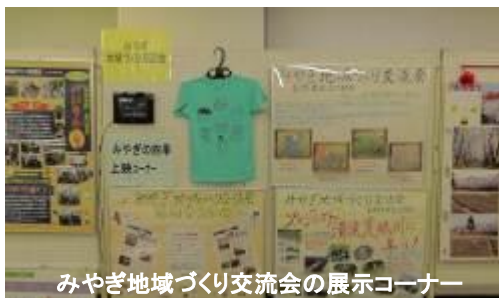
みやぎ地域づくり交流会の展示コーナー