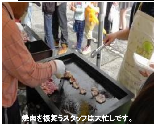
焼肉を振舞うスタッフは大忙しです。

毎年恒例となりました、第7回目のみやぎいいもん祭りを11月2日(日)に開催いたしました。今年も「芋」をテーマにした「いいもんケーキ、いいもん汁、焼き芋」や長い行列となりました。宮城地区畜産連絡協議会による焼肉などの数々の模擬店が並び、また話題となった巨大レインボードーム内で中学生による輪投げコーナーや的当てコーナー、新企画のバルーンアート教室など楽しい催しが行われました。当日は天候にも恵まれ、たくさんの来場者でにぎわいました。