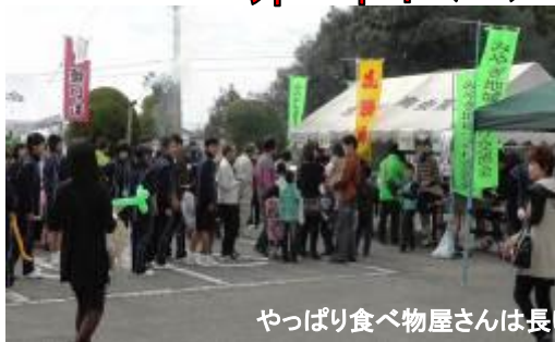
やっぱり食べ物屋さんには長い行列が出来ました。