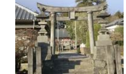
【集落センター北・苗島神社鳥居】