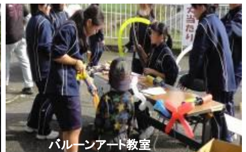
バルーンアート教室