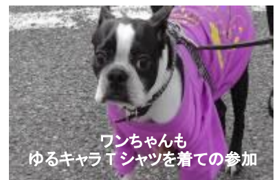
ワンちゃんもゆるキャラTシャツを着ての参加