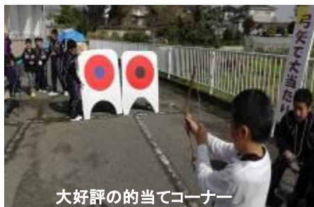
大好評の的当てコーナー