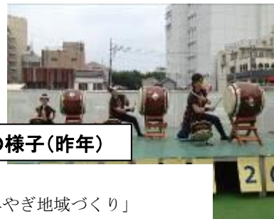
交流フェスタの様子(昨年)