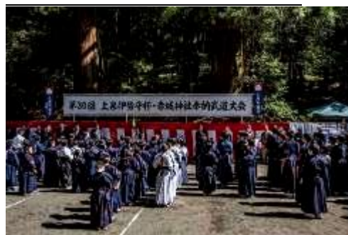
【 武道大会開会式風景 】