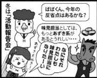
作: 下野実 画: 榎澤安之 ©みやぎ地域づくり交流会