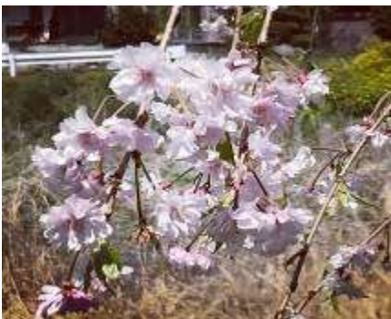
荒砥川河川沿いのしだれ桜

4月8日に桜苗を植栽してから7年が経過した、しだれ桜の鑑賞会を開きました。 残念ながら、今年は開花が早く、葉桜が目立ちましたが、楽しい鑑賞会となりました。 このしだれ桜は、平成21年と平成22年の2年間で荒砥川の河川沿いに70本の桜苗の植栽をみやぎ地域づくり交流会で行いました。おかげさまで本年までの間に延べ900人を超える多くの住民の方に荒砥川河川の美化活動にご協力いただき感謝申し上げます。 (大崎博之記)