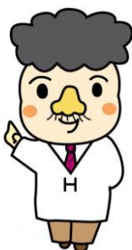
鼻毛石町キャラクター ハナイン博士