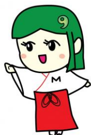
苗ヶ島町キャラクター なえちゃん