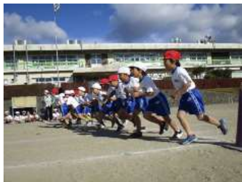
11月26日持久走チャレンジ