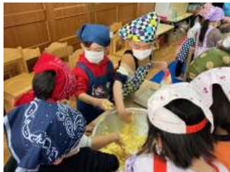
シュートレーン作り