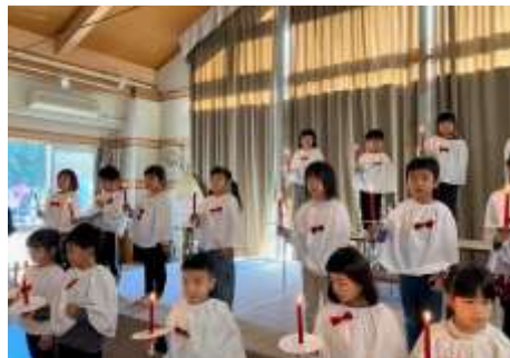
年長組キャンドルの集い

併せて、子育て支援センター「ひなたぼっこクラブ」では、12月12日（金）に一足早くクリスマス会を開催しました。宮城地区民生委員の皆さまや、赤城育心こども園のOB・OGボランティアの方々にご協力いただき、合奏や歌、プレゼント交換、会食を楽しみました。世代を超えた温かな交流の時間となり、地域とのつながりを感じるひとときとなりました。