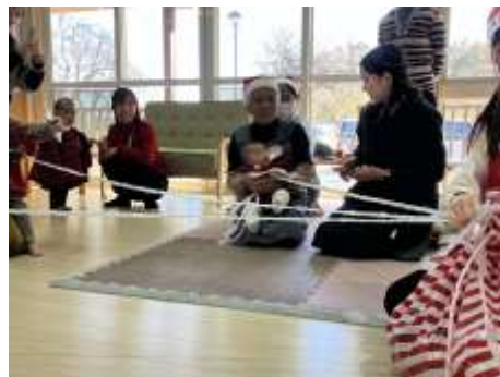
ひなたぼっこクラブ