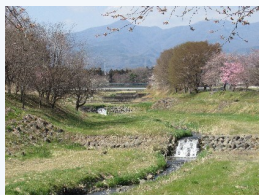
(写真) 清流粕川の流れ