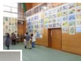
体育館内作品 展示の様子