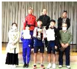
優勝 新屋チームの記念撮影