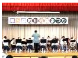
吹奏楽部演奏 など体育館内 ステージ発表

観覧しても出演・出品しても楽しい文化祭。来年もたくさんの方の参加をお待ちしています！