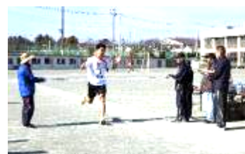
トップでフィニッシュ！