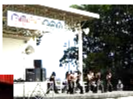
屋外ステージ 発表の様子