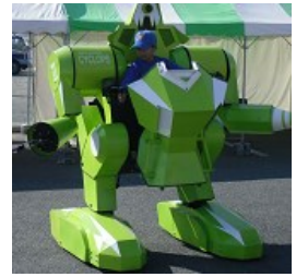
【乗用ロボット搭乗体験】