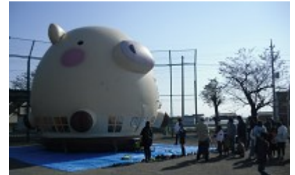
【ころとんフワフワドーム】