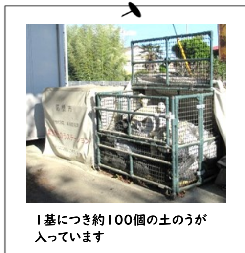
1基につき約100個の土のうが入っています