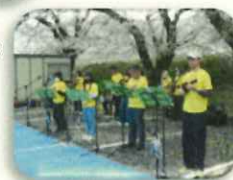
かすかわロコモコのウクレレ演奏