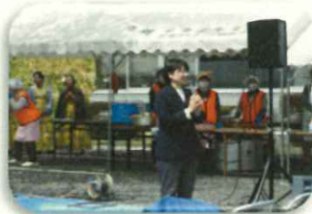
小川市長のあいさつ

本年度も、一級河川粕川の環境美化活動、桜樹木維持管理など実施してまいります。何卒ご理解、ご協力のほどよろしくお願い申し上げます。