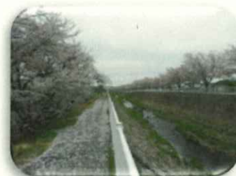
粕川堤防の桜(満開)