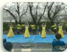
ブルメリアのフランドス