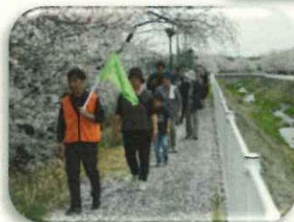
お花見ウォーキング