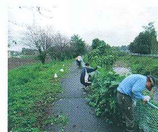
第2回目と第3回目の草刈り作業