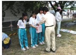
中学生による募金活動