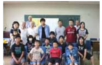
講師と参加者のみなさん

6月29日、7月6日、13日に、富士見公民館において「初心者のための囲碁教室」が開催されました。子どもから大人まで、たくさんの方が参加し、囲碁の基本を教わりました。講師のわかりやすい説明で参加者は楽しく碁石を打っていました。