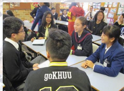
日本語の授業に参加

*詳しくは募集要項にあるので、興味を持ったらすぐに先生から募集要項を入手しよう！