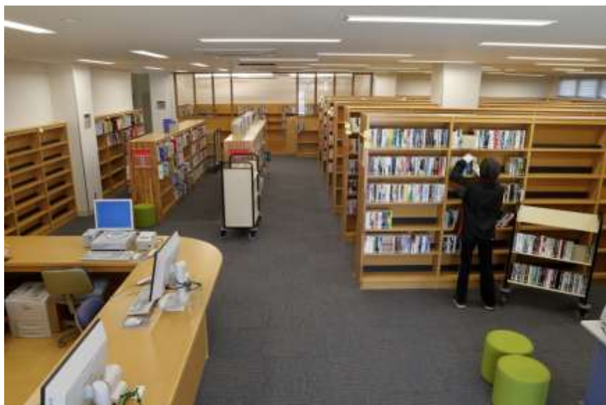
開館へ向け準備が進む館内は明るく開放的な雰囲気