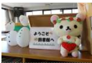
飾り ようこそ図書館へ