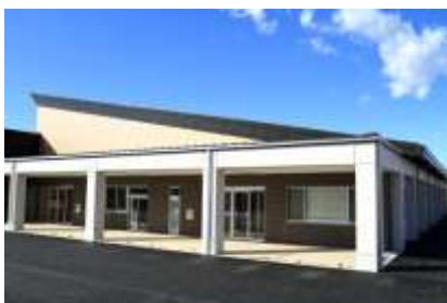
分館側からの公民館外観