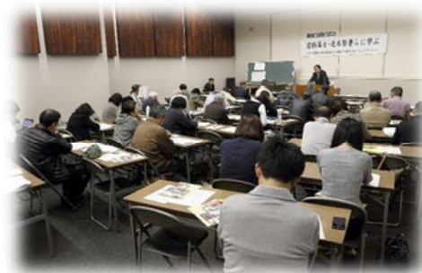
昨年開催の文化講演会の様子