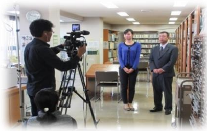
写真は作宮館長のインタビュー風景