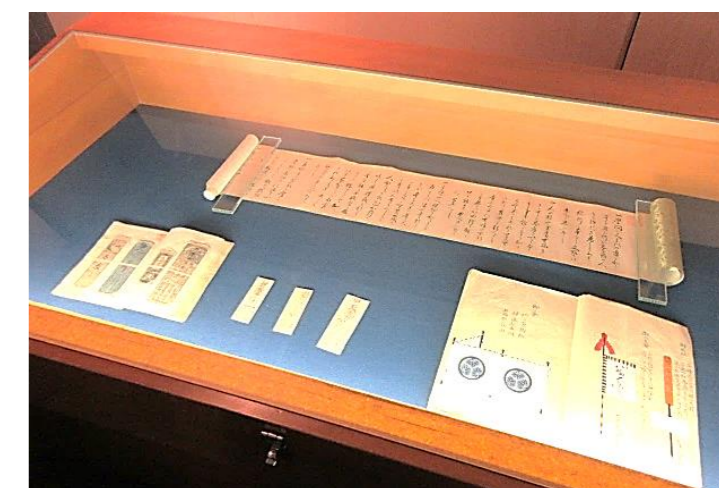
前橋藩の藩札なども並びます