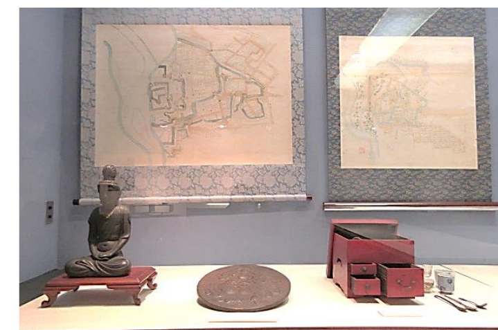
細谷而楽作品、前橋城図など