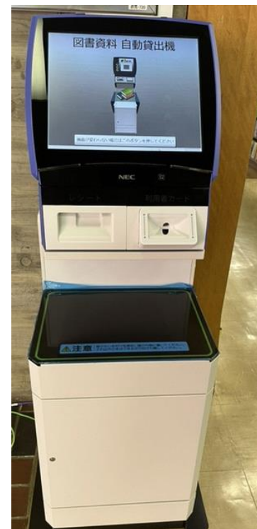
本館中央図書室に設置の自動貸出機