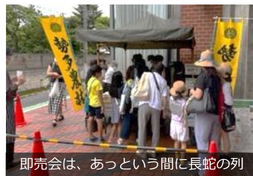
即売会は、あっという間に長蛇の列