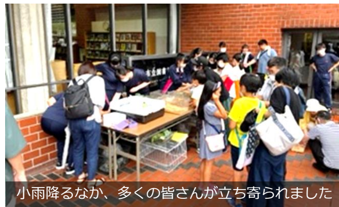
小雨降るなか、多くの皆さんが立ち寄りられました

思いに楽しまれていました。何より生徒の皆さんが、お客さんと一緒に楽しんでいる姿と、動物たちと触れ合う子供たちの笑顔が印象的でした。