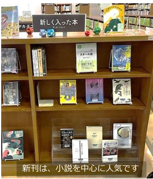
新刊は、小説を中心に人気です