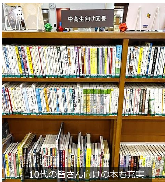
10代の皆さん向けの本も充実

最近よく耳にする言葉「クールシェア」。クールシェアとは、みんなで涼しい場所に集まって、涼しさを共有する取組です。涼しい館内での読書はもちろん、宿題の自由研究の調べものや、研究資料の閲覧等に図書館を利用しませんか。この夏の新刊本も続々配架中です。宿題のヒントになりそうな本はもちろんのこと、読書感想文の課題図書も取り揃えてあります。各種イベントも開催しますので、ご来館をお待ちしています。