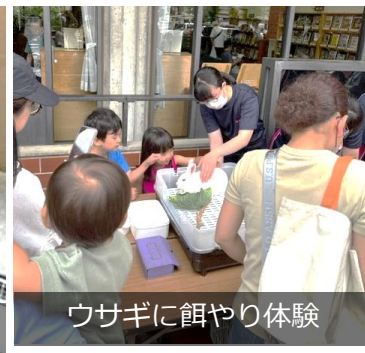
ウサギに餌やり体験