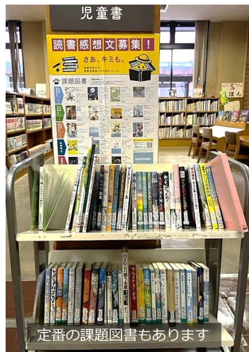
定番の課題図書もあります