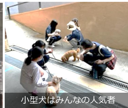
小型犬はみんなの人気者