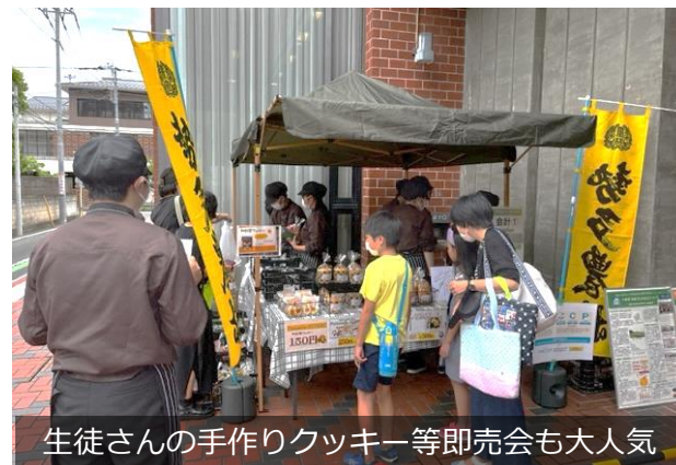
生徒さんの手作りクッキー等即売会も大人気