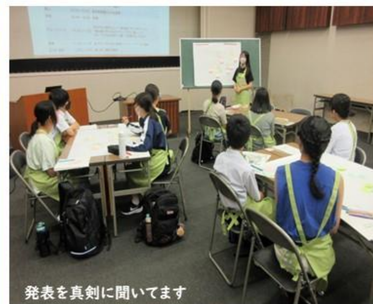
発表を真剣に聞いてます