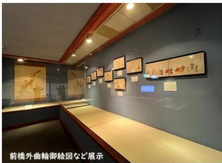
前橋外曲輪御絵図など展示

会期中は、期間を区切って祇園祭礼絵巻の場面を替えながら紹介しますので、ぜひ何度でも足をお運びください。