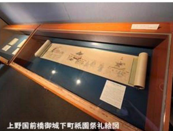
上野国前橋御城下町祇園祭礼絵図