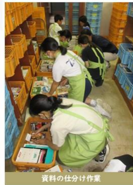
資料の仕分け作業