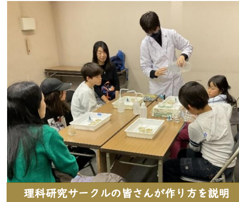
理科研究サークルの皆さんが作り方を説明

12月14日に市立前橋高等学校理科研究サークルによるワークショップが開催されました。 参加者の方々にサークルの皆さんがスノードームの作り方をレクチャー。綺麗に仕上がった スノードームに参加者の皆さんはご満悦でした。作成後、関連図書を読む人も多く、本当に 嬉しかったです。理科研修サークルの皆さん、本当にありがとうございました。