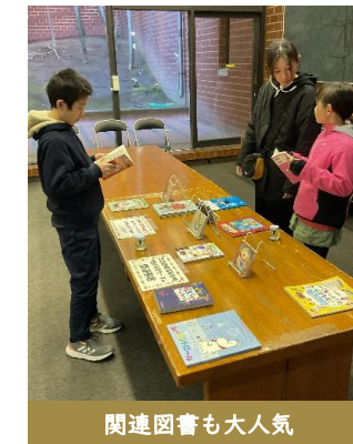
関連図書も大人気