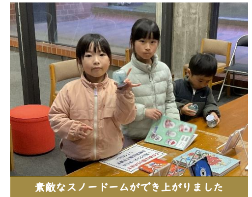
素敵なスノードームができて上がりました