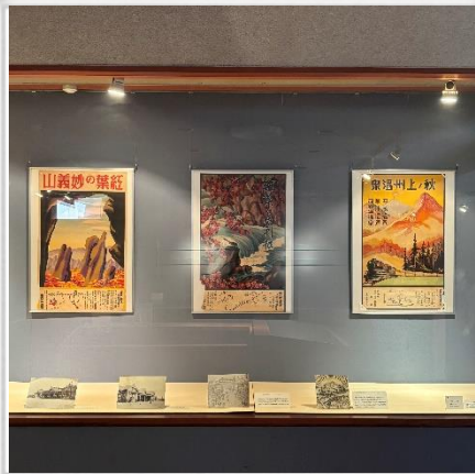
東京鉄道局作成のポスター

東京鉄道局作成のポスター、一府十四県連合共進会開催中の鉄道時刻表、上毛電鉄の沿線地域の歴史や名所について取り上げた『上毛電鉄沿線概観』など