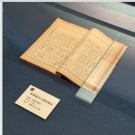
『四季毎日三食料理法』

江戸時代に作成された漬物のレシピ集『漬物早指南』、365日分の献立と調理法が掲載されている『四季毎日三食料理法』、明治時代の料理小説『増補注釈食道楽』など