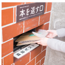
2 返却ポストに投函できます

CDやDVDも本と同じように予約することができます。他館にあるものも取り寄せができますので、普段利用する図書館にないものは検索してみてください。