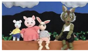
人形劇『帰ってきたぜ！ おおかみガブッチョ』

おはなしの会もここのオリジナル演目。まぬけなオオカミ、獲物をさがして大失敗！ごちそうに、ありつけるのはいつ？