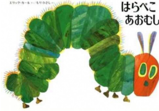
はらぺこ あおむし