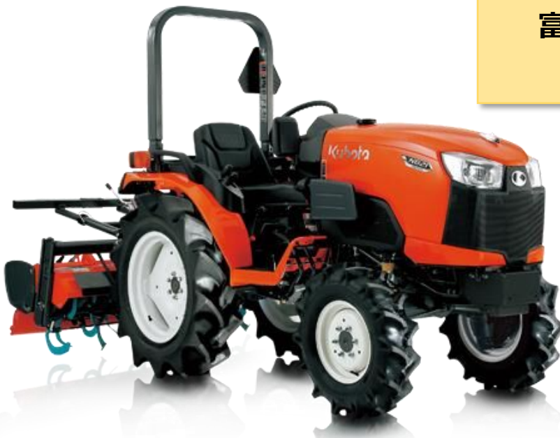
21馬カトラクタ+ 標準ロータリ 1.4m