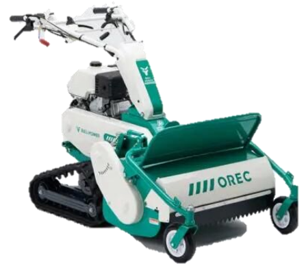
草刈り機 OREC HRC665