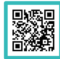
ステーション マップ