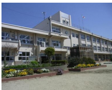
令和5年度 下川瀬小学校 教室配置図